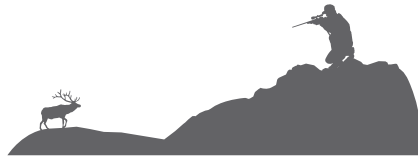
Поправка на падение пули 28 дюймов

Линия прицеливания 376 ярдов Угол -33 градуса