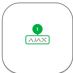
1 - Логотип со световым индикатором.