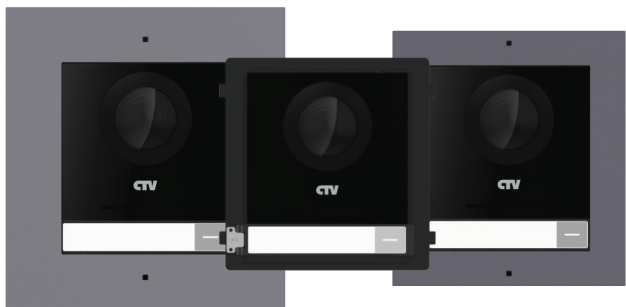
CTV-IP-UCAMF CTV-IP-UCAM CTV-IP-UCAMS