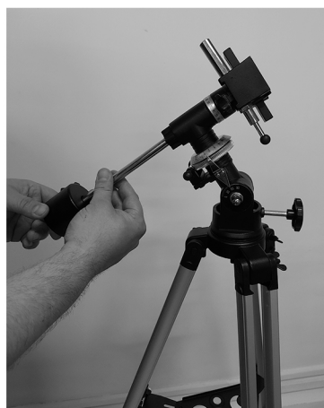
6. Соберите противовес экваториальной монтировки и установите его