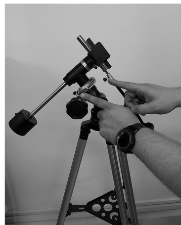
7. Снимите резиновые колпачки и установите рукоятки тонких движений.