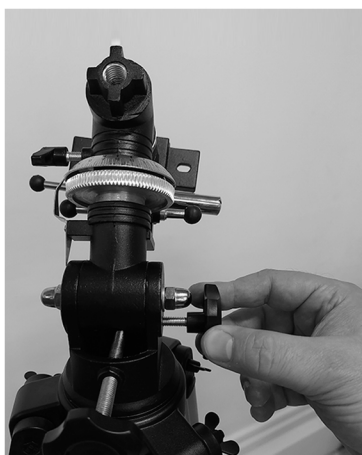
5. Установите диагональное зеркало в фокусер и зафиксируйте положение с помощью винта