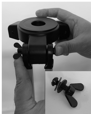
2. Установите распорки штатива