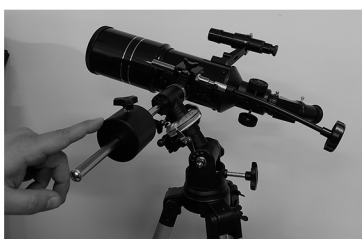
9. Ослабьте фиксирующие винты обеих осей и с помощью положения противовеса добейтесь равновесия телескопа