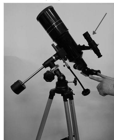
8. Установите окуляр в фокусирующий узел телескопа и видеоискатель.