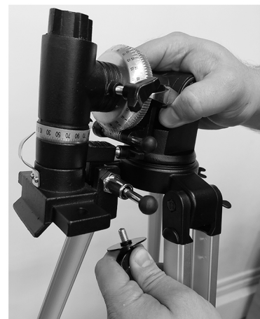
4. Установите экваториальную монтировку на штатив