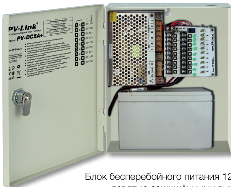
Блок бесперебойного питания 12В 5А с девятью защищёнными выходами