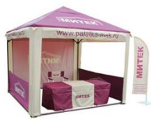
БРЕНДИРОВАНИЕ НА ТЕНТАХ