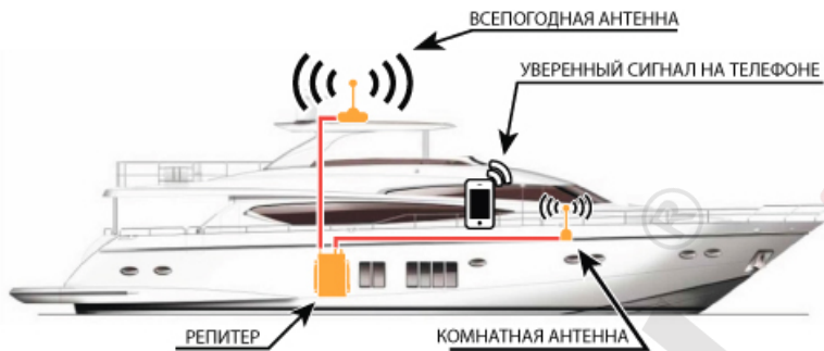
Схема №2. Пример установки системы усиления сотового сигнала на яхте.

Для наглядной проверки качества электромагнитной развязки проделайте следующую последовательность действий: