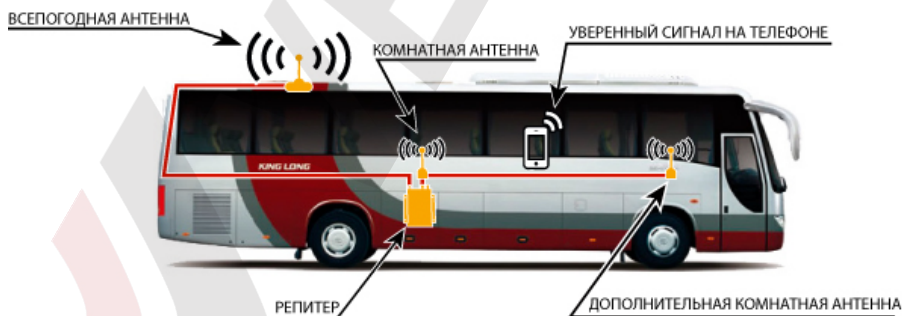
Схема №1. Пример установки репитера в автобусе.

Репитер представляет собой высокочувствительный двунаправленный СВЧ-усилитель сотового сигнала, поэтому при его установке нужно, чтобы всепогодная и комнатные антенны были хорошо изолированы друг от друга и не возникло самовозбуждения репитера. Чтобы на наглядном примере понять, что такое самовозбуждение, возьмите, к примеру, микрофон и громкоговоритель и поднесите их близко друг к другу – вы услышите очень сильный шум. Репитер будет работать бесперебойно только в том случае, если электромагнитная развязка будет достаточной для устойчивой работы системы усиления сотового сигнала.