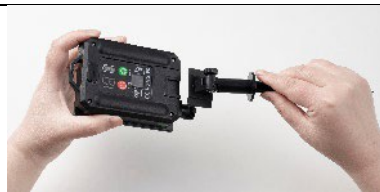
2. Соедините штырь с контроллером