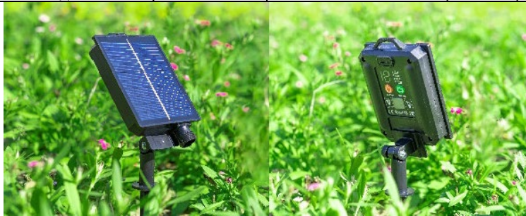
3. Установите солнечную панель согласно изображению