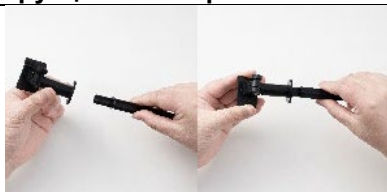
1. Соедините штырь