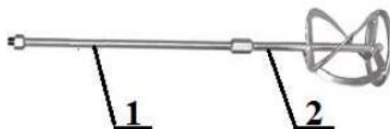
Рис. 2 Сборка насадки

• Используя гаечные ключи, ввинтите в удлинитель 1 перемешивающую насадку 2 до упора